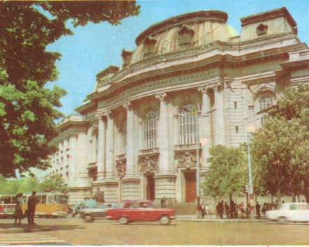
Университет "Климент Охридски"

Цените на леглата за пренощуване са от 1,20 до 9,00 лв. в зависимост от категорията и ползването на пансион.