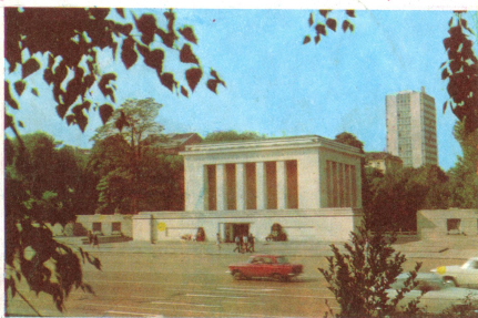
Мавзолеят на Георги Димитров

СОФИЯ - столицата на Народна република България, заема сръдищно място на Балканския полуостров. Разположена е в сред обширно поле в подножието на планината Витоша на 550 м надморска височина. София има около 900000 жители. Тя е най-важният административен, политически, икономически и културен център на България. София е известна също така като курортен и балнеоложки център. В очертанията на града има около 20 минерални извора с различен състав и лечебни качества на водата. Надяваме се, че картата, която Ви предлагаме ще улесни Вашето пребиваване в София. Пожелаваме Ви приятен престой в столицата на Народна Република България.