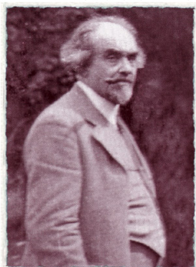
Николай Бердяев (1874-1948)

Русия, така и за човечеството – загиването на Руската империя и появата на СССР, раждането на фашизма, националсоциализма, комунизма и Втората световна война. Така Бердяев успява да опознае почти всички видове държавно управление – царския абсолютизъм до 1917 г., след това комунизма, по време на изгнанието си във Франция – буржоазния западен тип, а също