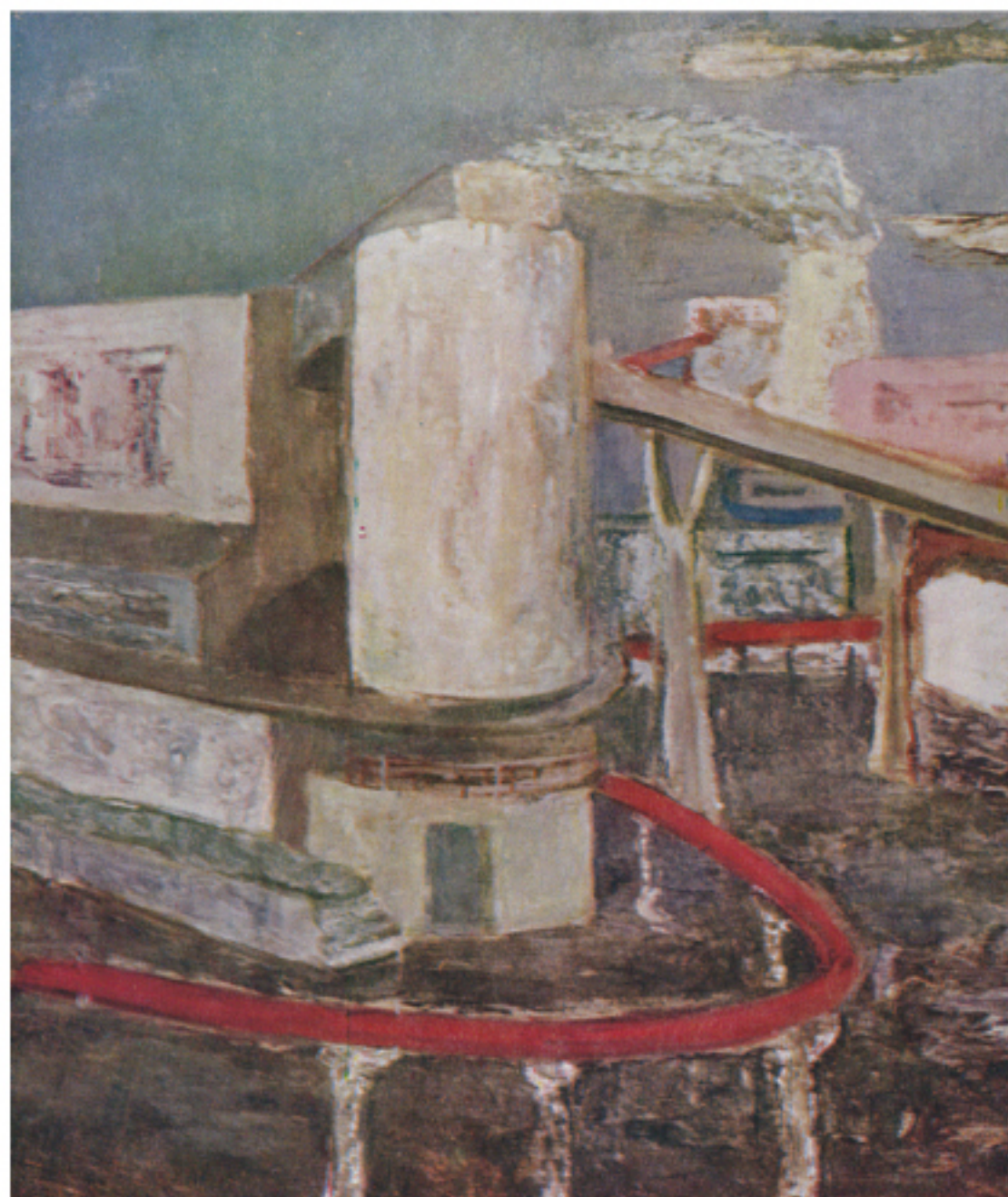
Индустрията като вдъхновение 3: Индустриален пейзаж, 1969. Творба от Вл. Гоев

са осигурени съществени в сравнение с други професии социални привилегии (сравнително високи заплати и