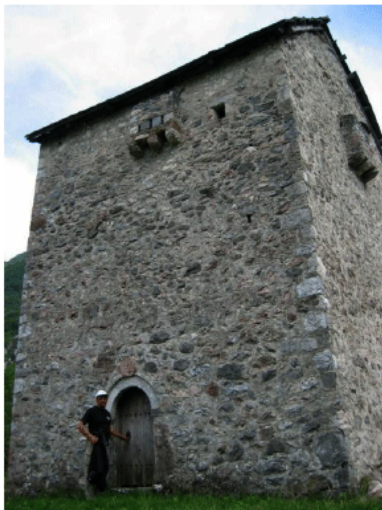
Сн. 9. Каменна кула, където се били затваряли заплашените от кръвно отмъщение

самостоятелност и независимост. От първостепенна необходимост било загърбването на кръвните вражди. Това донякъде обяснява как се стига до една от най-успешните инициативи за прекратяване на кръвните отмъщения: става дума за започналото през февруари 1990 г. всенародно помирително движение в Косово, което завършва през май 1992 г.