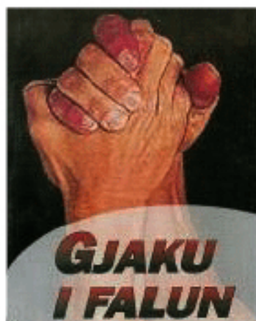
Сн. 5. Пропаганден плакат „Простената кръв“

оставят в продължение на години жените и децата си сами да се борят за оцеляването си. Много деца пък не могат да продължат образованието си, тъй като се затварят по къщите си. Така за 2002 г. по данни на Министерството на образованието 147 деца прекъсват обучението си заради вендетата, а според Дружеството на жените те са 712. Медиите пък пишат за 800 такива деца. Подобен брой се отчита и през 2004 г.