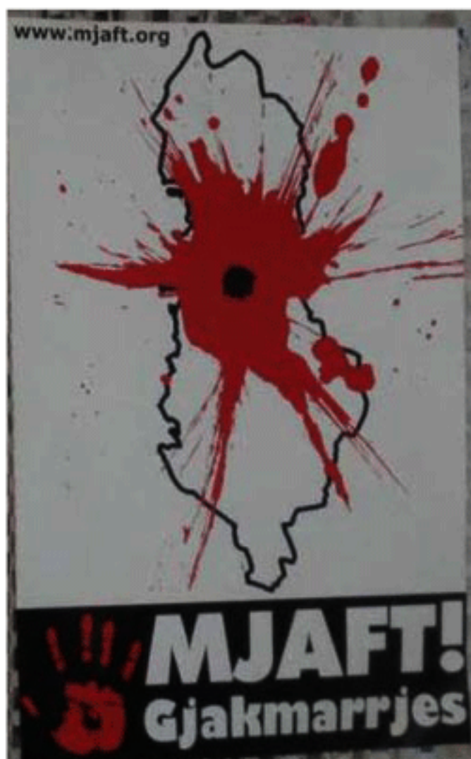
Сн. 7. Афиш на организацията Мјафт с призив „Стига кръвни отмъщения“

преразглеждане на Наказателния кодекс; към уважение и подкрепа на Движението на жените в борбата им срещу насилията и трафика на момичета. Отправя се и апел към медиите, които да контролират емисиите и публикациите си, т.е. да избягват пропагандата, провокираща психологията на кръвното отмъщение.