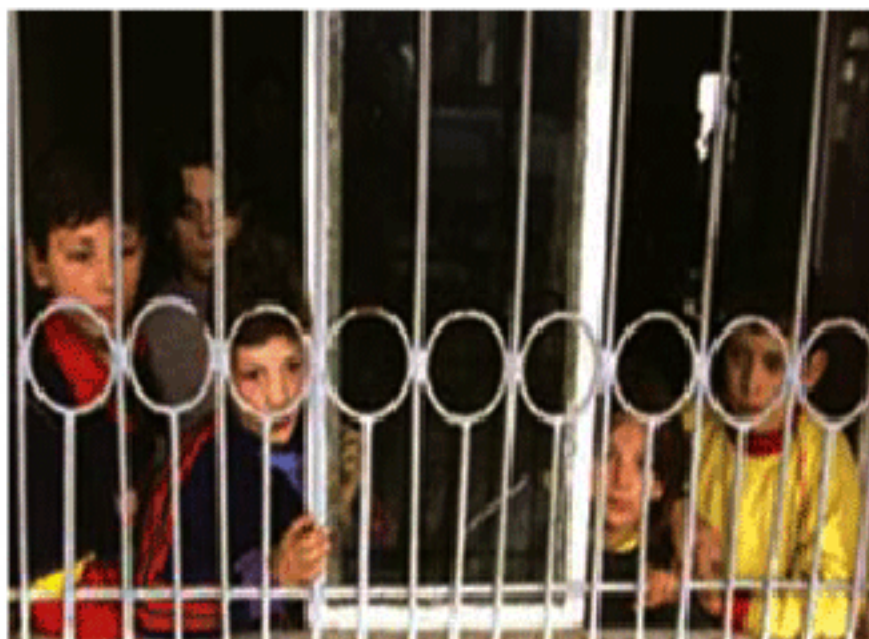
Сн. 4. Деца, затворени заради заплахата от кръвното отмъщение

вендата. През 2005 г., само заради трафика на жени 4600 семейства са в дълбок конфликт, смята Джин Марку председател на комитета. През 2002 г. Дружеството на жените твърди, че са станали 3000 такива убийства. За следващата 2003 г. Социалното министерство съобщава за около 7 000 души, от които поне 1024 деца, живеещи под заплахата от убийство. Според сп. „Шекули“ общо около 3000 семейства днес са в кръвна вражда. Да не забравяме, че днешното албанско семейство е около 8-10-членно, което ще рече, че поне 25 хил. души са заплашени от вендата.