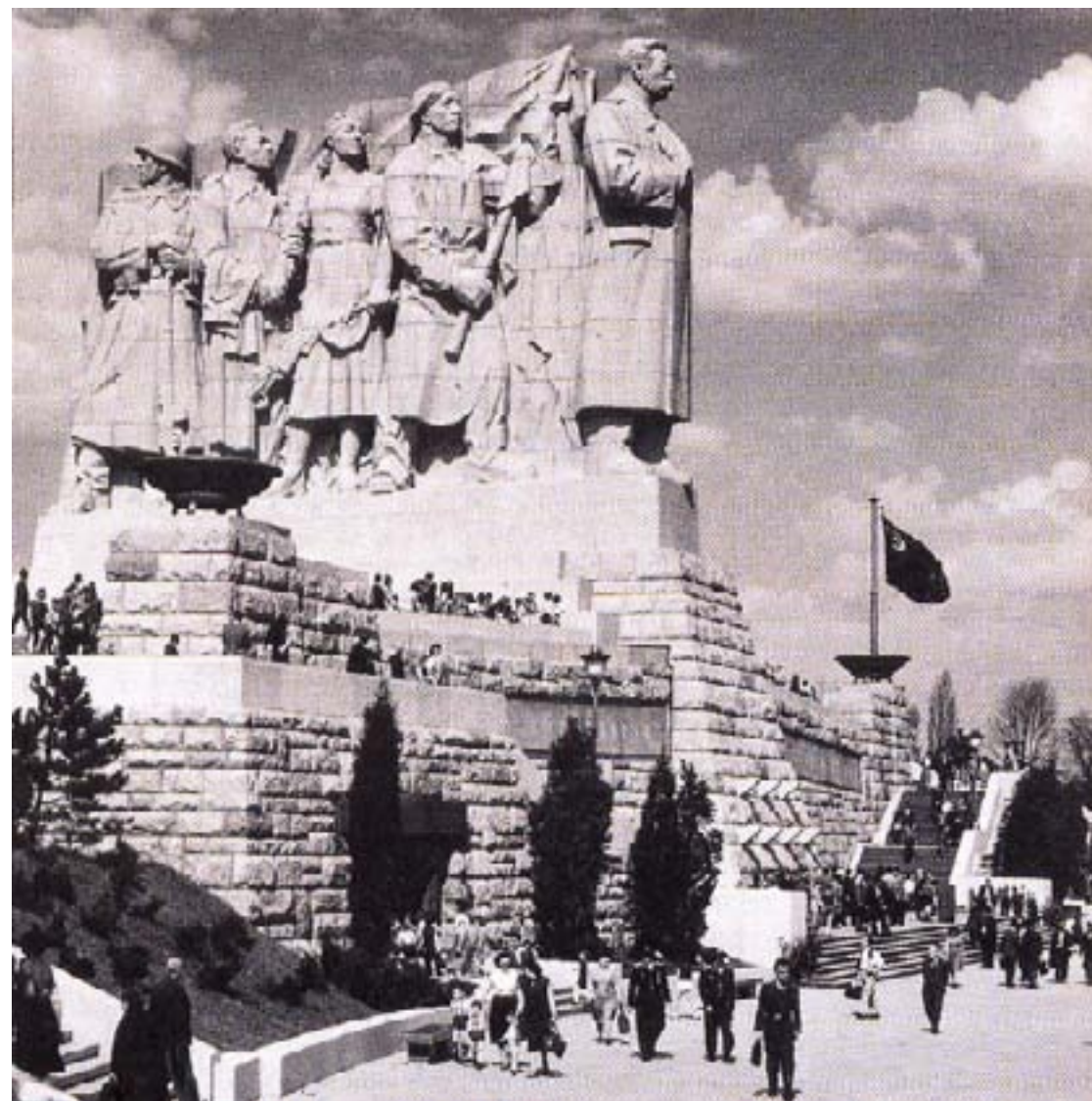
Грандиозният паметник на Сталин в Прага

През 90-те години е характерно потискането на отхвърлянето на съветското наследство, наблягане върху елементите на руската държавност (именно тогава П. А. Столипин е припознат и наложен като ключов символ на реформаторската политика в руската