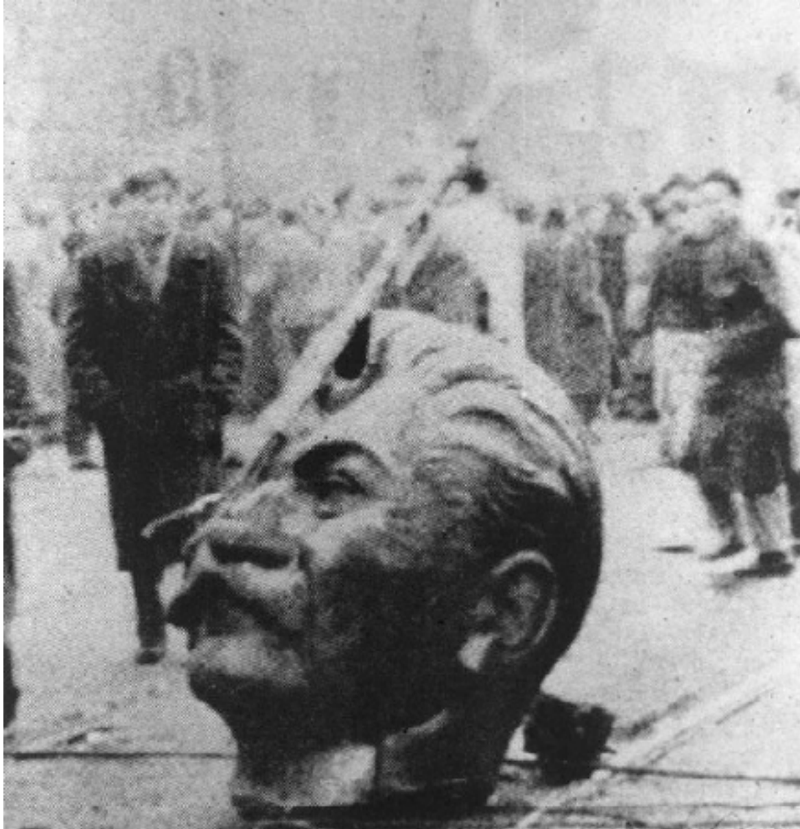
Рушене на паметника на Сталин Будапеща, 1956 г.

Но през 2000 г. с промяната на властта в Русия, след като Владимир Путин заема президентския пост цялото отношение към историята и политическата символика на миналото постепенно започва да се променя. Приема се, че не е възможно да се изтрият 70 години от собствената история и да се намерят достатъчно антиподи на „героите“ от предишната епоха, които биха послужили за нова самоидентификация на руското общество (В този процес голяма роля играе дълбоката обществена и икономическа криза на либералния модел, който се развива по време на „Ерата Елцин“, заплашваща с по-нататъшна дезинтеграция на страната, както и крайно пасивната и на моменти противоречивата външнополитическа ориентация на елциновата администрация). На символично ниво промяната се вижда и през изменението на някои държавни символи (връщането на химна на Александров), но много повече