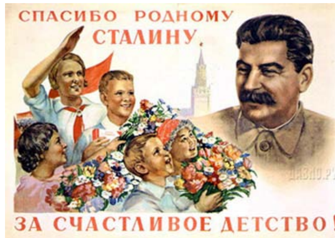
Пропагандни плакати от 30-те