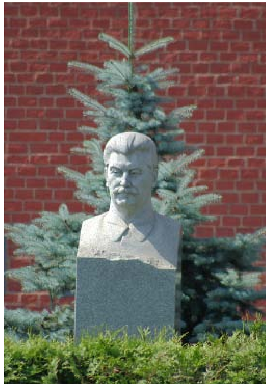
Надгробният паметник на Сталин

Имайки пред себе си този неочакван „завой“ в общественото съзнание и колективната памет, най-изтъкнатите съвременни руски политици като президента