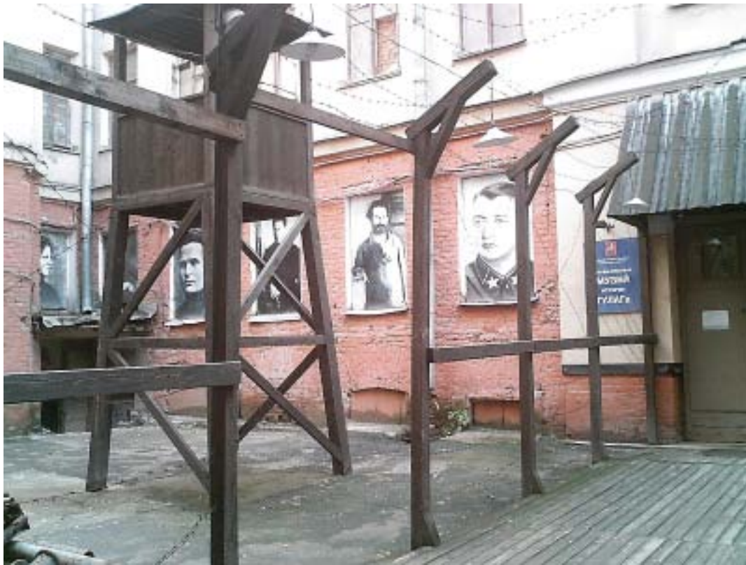
Музеят на ГУЛАГ в Москва

но много успешна модернизация на страната, преди всичко индустриалната модернизация, която чрез мъдра и стратегическа външна политика осигурява величествена победа във Великата отечествена война против нацистка Германия, съответно изключително бързо е усвоила ядрените технологии след Втората световна война и производството на атомна бомба, което осигурява изравняване на стратегическото предимство на САЩ и прерастването на СССР в едната от двете световни суперсили... Наистина, дори и привържениците на подобно тълкуване на сталинската политика и заслуги са готови да признаят репресиите на сталинизма и