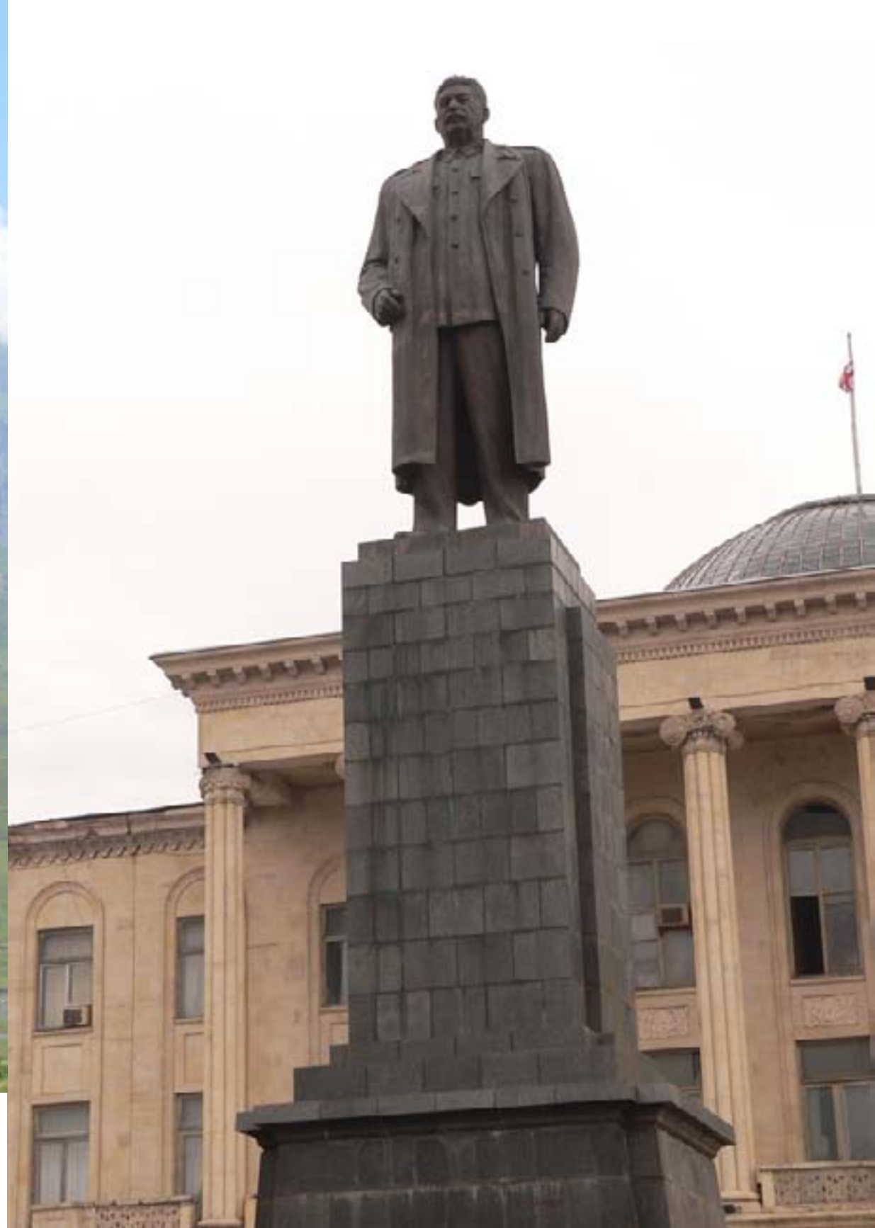
Паметници на Сталин във Владикавказ и родното му място - Гори