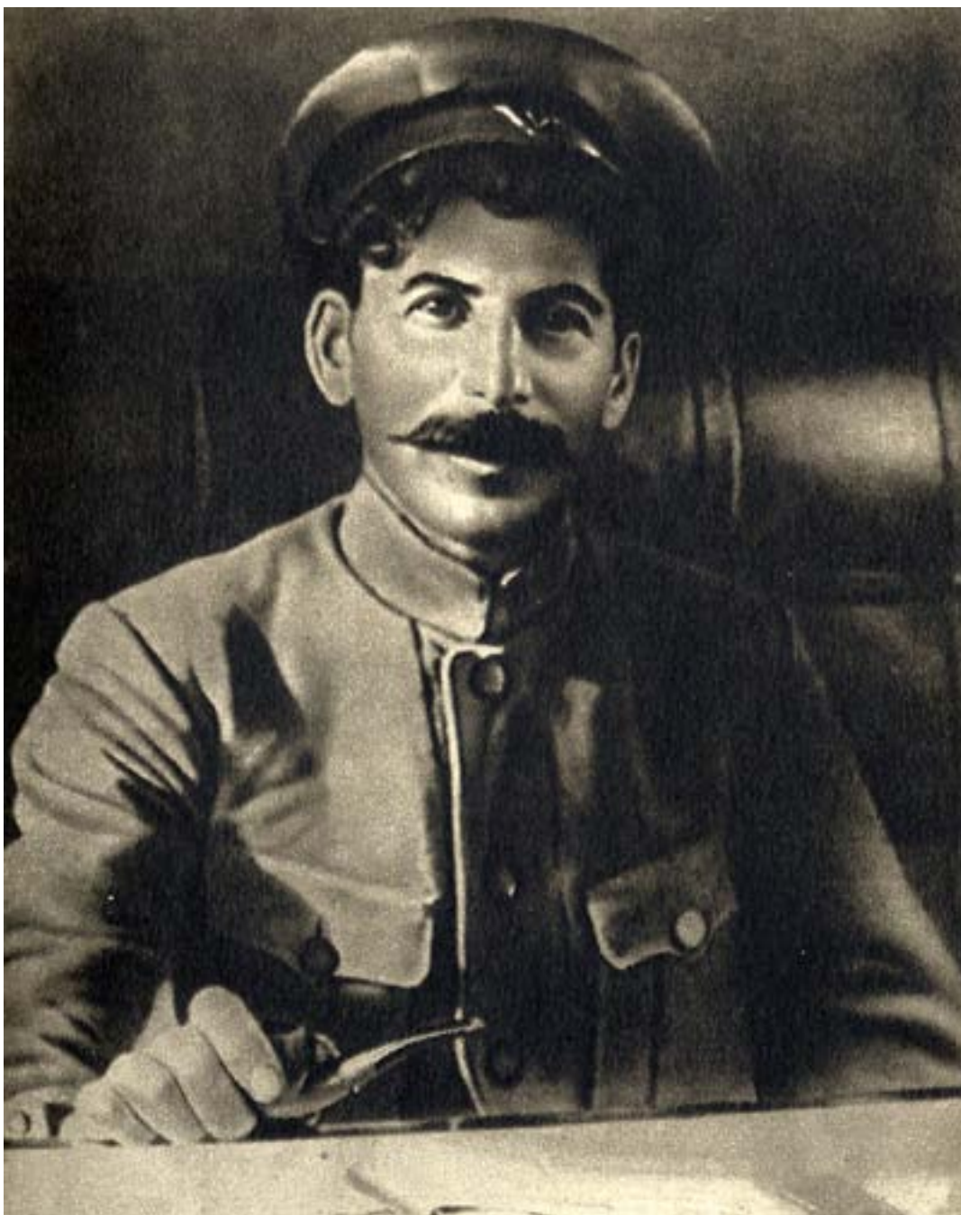
Гражданската война, на фронта при Царицин, 1918 г.

г.), Бухарин, Риков и Томски (1929-30 г.)... Най-накрая Сталин изгражда окончателно основите на система