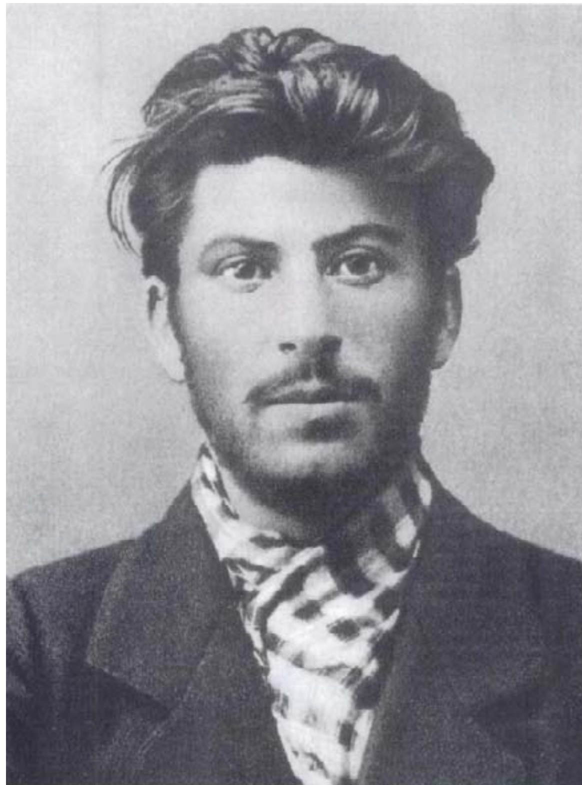
Коба през 1902 г.

Свеждането на биографията на Йосиф Висарионович Сталин до няколко изречения изглежда почти утопична задача. Огромният брой биографии на един от най-влиятелните държавници на 20 век ни предлага абсолютно противоречиви характеристики. За него четем, че е бил суров диктатор и „баща на народите“; че е бил безспорен водач на руските комунисти и световното комунистическо движение и в същото време, че е унищожил „ленинската гвардия“ и „цвета на цялото комунистическо движение“... Като че ли границата между злодея и гения е напълно изтрита. И все пак е възможно да се представят основните факти от бурния му живот и