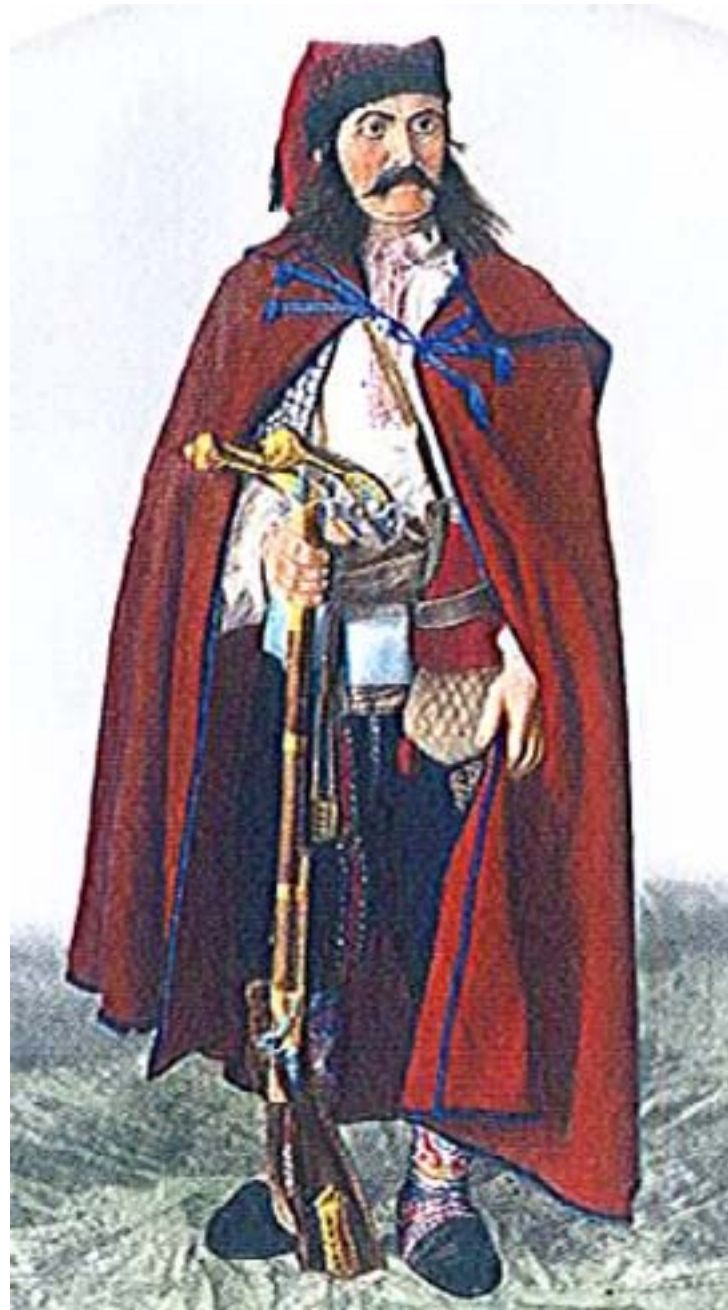
Снимка №4 – мъжка сръбска носия, фото Т. Л. Митрейтер, 1880, РЕМ.