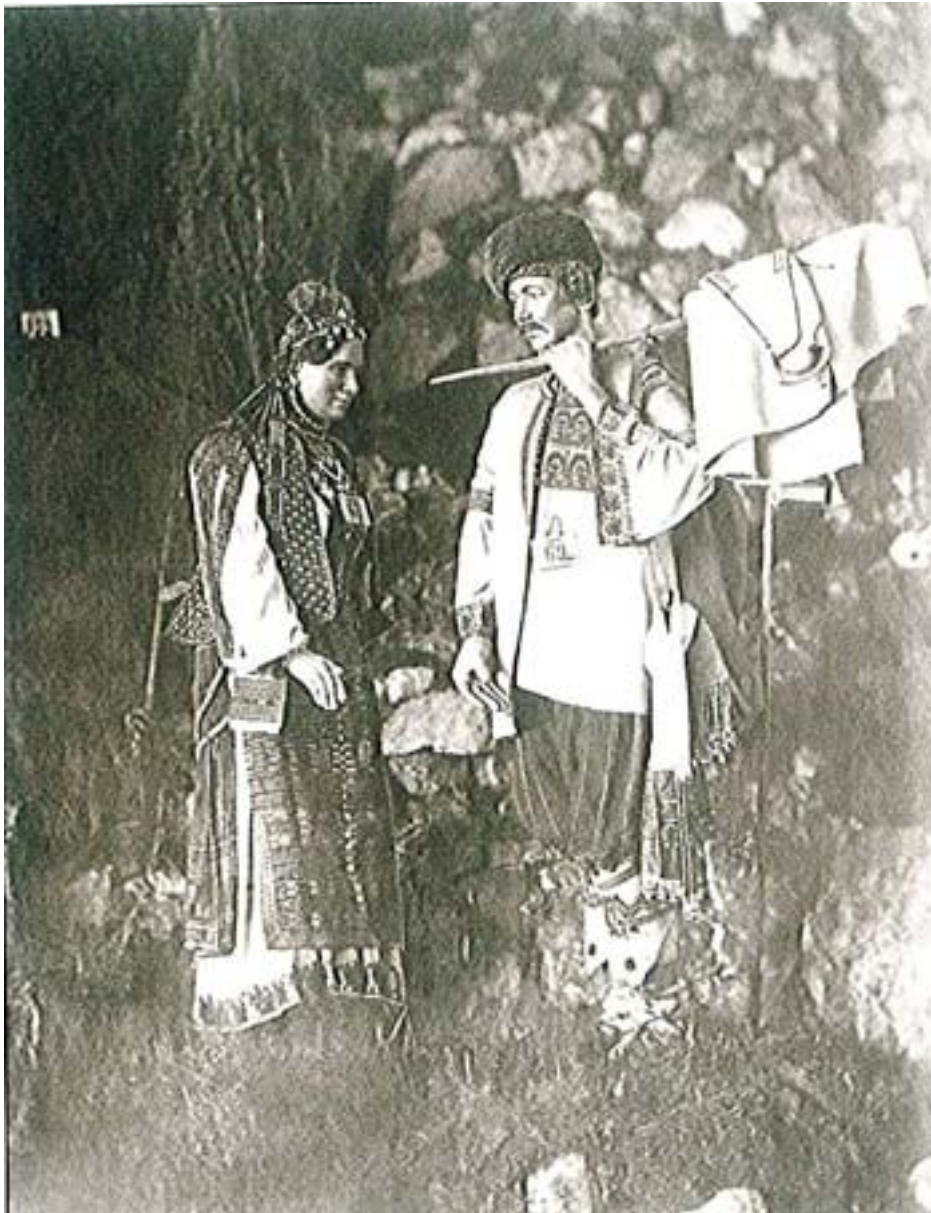
Снимка №8 – сцена „Придунавски българи от Търновско“, снимка от изложбата от 1867 г.

The author suggests some hypotheses about measure of the Bulgarian space in Russian political doctrine and about hole concept of Bulgarians that the Russian society had.