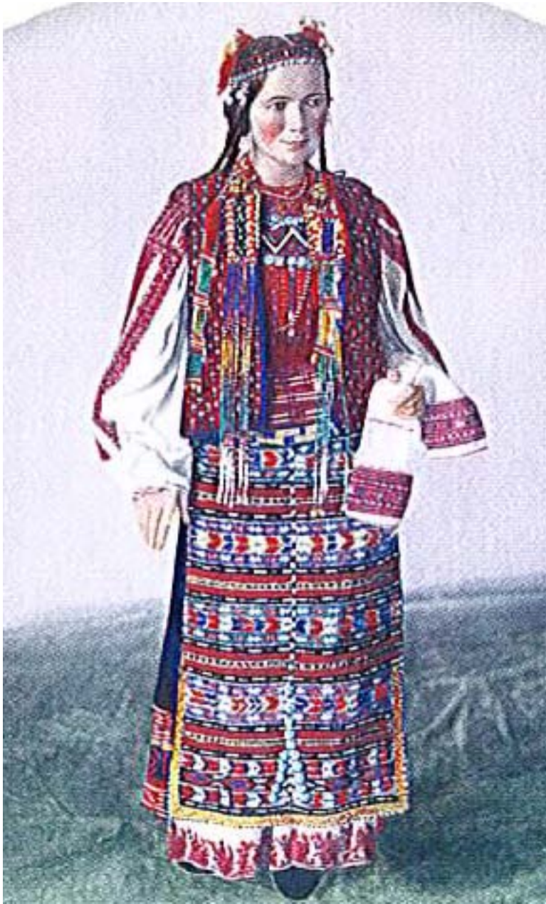
Снимка №3 – женска носия от Търновско, фото Т. Л. Митрейтер, 1880, РЕМ.