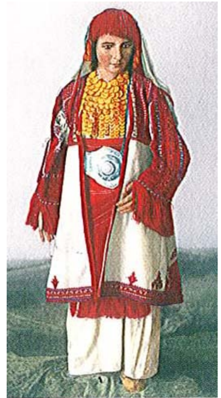
Снимка №5 – женска носия от региона на Битоля (с. Смилево), изпратена от Ст. Веркович