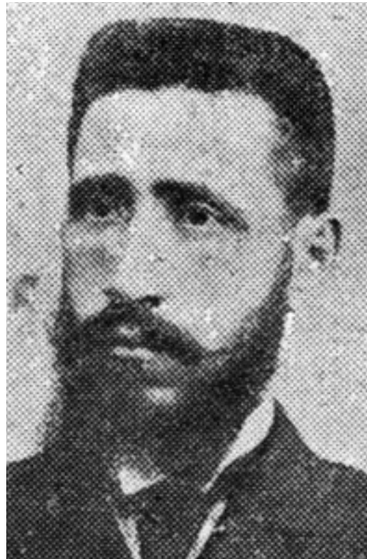
Михаил (Мише) Развигоров (1873-1903)

дават. „Въобще сватбите бяха много масрафлии и трудно бе за момъка да се задоми, а момите оставаха при бащите си до 30 - 35-годишна възраст. Така се стигна до разврат, който се вършеше не само с българи, а и с турци.“ Организацията съкращава времетраенето на сватбите от 3 на 1 ден, а откупът, даван от младоженеца на бъдещия си тъст, е намален между три и пет пъти. Ограничават се даровете – само за родителите и кума, разноските за сватбата трябва да бъдат до 200 гроша, а при годещ да се дава само пръстен. Освен това ВМОРО „забрани... и пиянството, едно за да не се изказват тайни в пияно състояние, а друго пък да не се харчат излишни пари.“