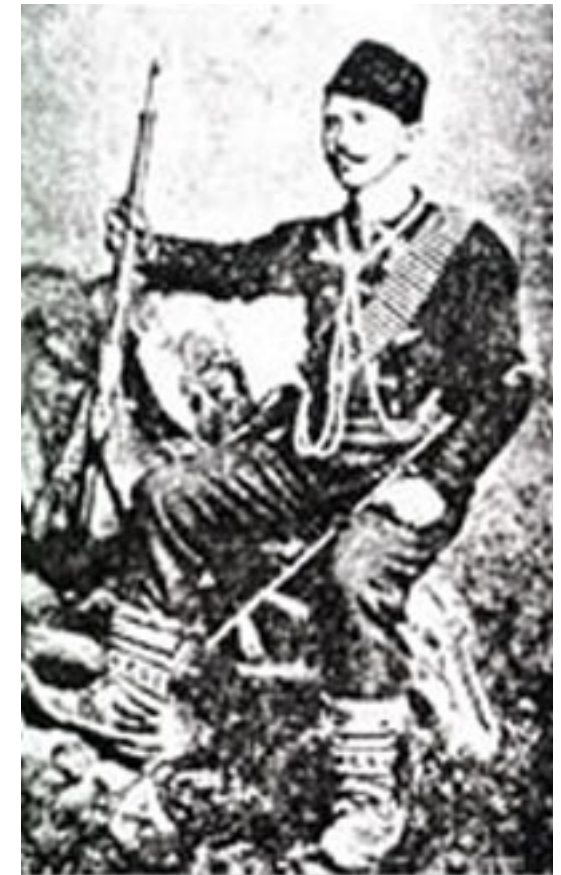
Йордан Пиперката (1870-1903)