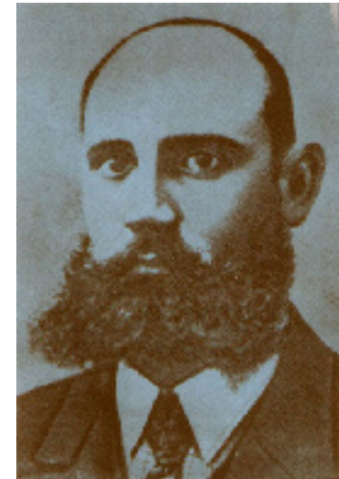
Яне Сандански (1872-1915)

Най-големи привърженици в Организацията на предприятия бойкот срещу гърците в Битолско се оказват конкурентите им български търговци, ханджии и бакали, които имат материална изгода. ВМОРО събира от всеки заминаващ за Америка по един-два наполеона, но някои хора на ВМОРО започват да злоупотребява и с това. Както споделя един от битолските окръжни ръководители, „това заприлича на еничарски времена“.