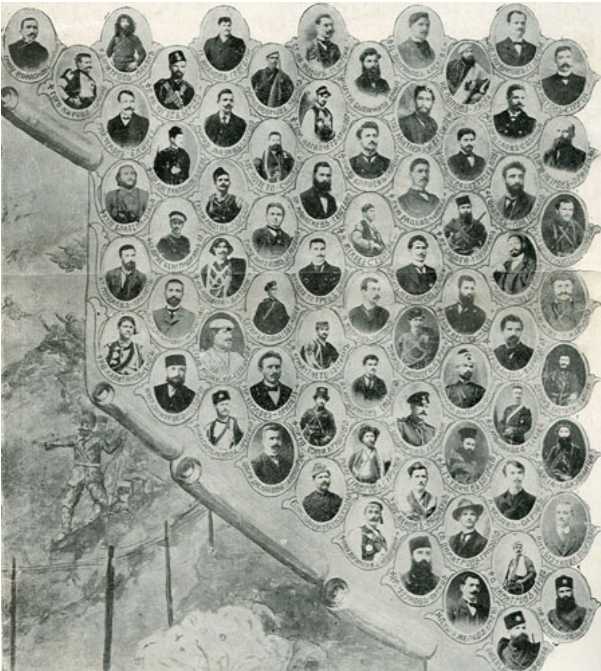
Табло със снимки на македоно-одринските дейци