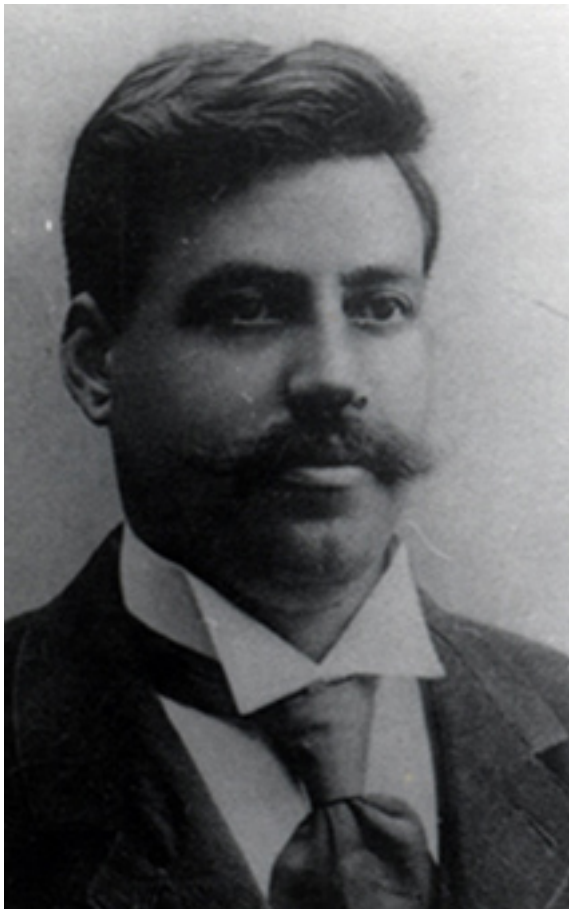
Георги Николов Делчев - Гоце (1872-1903)