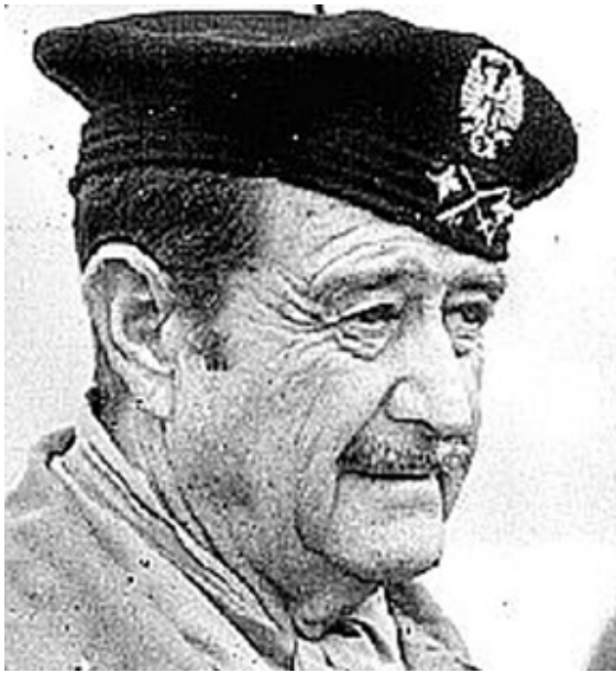
Ген. Миланс дел Бош