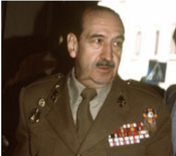
Ген. Алфонсо Армада