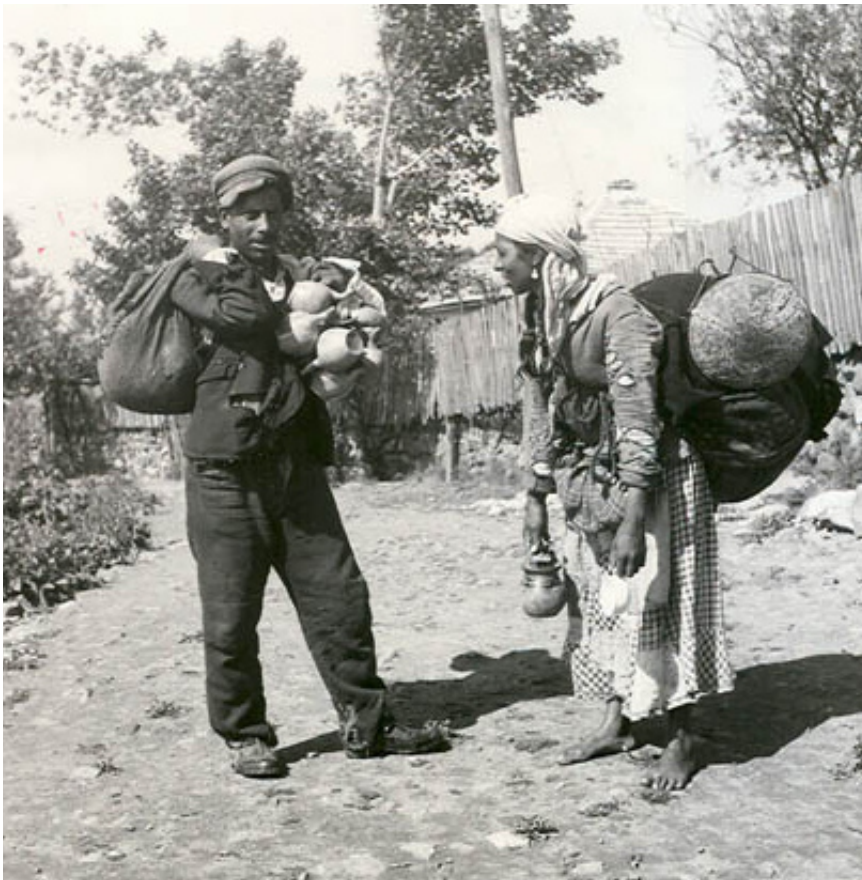
Чергари (Кардараша) по улиците на Ахтопол, 1949 г.

множество препятствия. Все пак тези от тях, които живеят уседнало, се оказват на крачка пред чергаруващите си събратя. Последните, са определени, в унисон с официалните разбирания, като "спирачка при по-нататъшното развитие на страната в културно и здравно отношение". 1