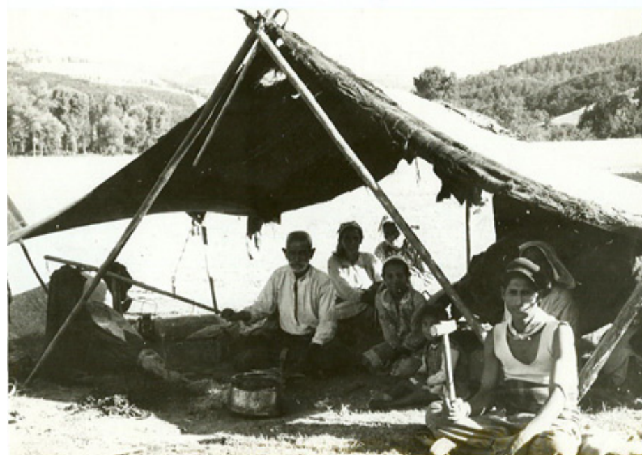
Чергарстващи тракийски калайджии (Влахуря) на палатка, 50-те години.