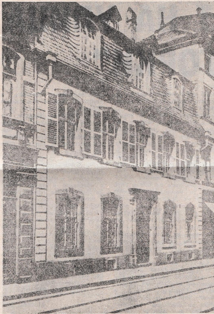
Родната къща на К. Маркс в Трир

Музеят винаги е пълен с хора. Внимателно и съсредоточено, с благоговение те разглеждат експозицията. На третия етаж са основните експонати. Голямо място е отредено на „Манифест на Комунистическата партия“. Могат да се видят оригиналите на първите издания, ранини преводи на различни езици. В съседното помещение се пази като скъпа реликва оригиналът на първия том на „Капиталът“, издаден на немски език. Най-ценните експонати на музея са ръкописи на Маркс, писма, фотографии, първи издания на трудове на Маркс и Енгелс в различни страни, книги с по-