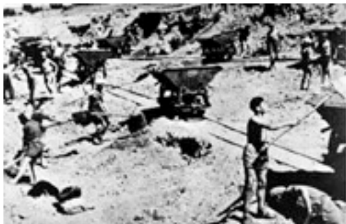
Бригадири на язовир „Росица“