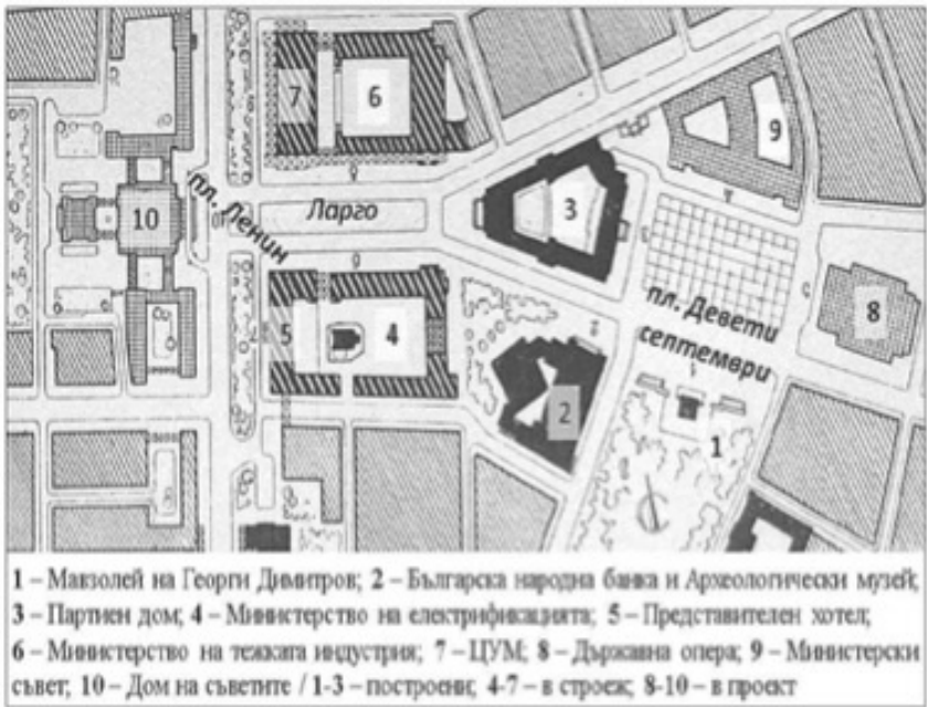
Фигура 2. Окончателен план на централната градска част на София (1952 г.) 27

градска част на София от пролетта на 1947 г., а именно, че външното представяне на фасадите е „пресилено“ за мащаба на тогавашната столица до такава степен, че би подействало „като агентат“ спрямо околната среда“ 25 . По това време отклонението от спуснатия от Москва идеологически канон е опасно, но проектантите все пак настояват да вложат и „нещо свое“. В процеса на сложно лавиране между идеологическите постулати и избягването на естетическото шаблонизиране 26 , именно рамката на „националната“ по форма и „социалистическа по съдържание“ архитектура предлага неочаквани възможности.